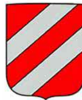
Skoed Staol Écu d'Étables