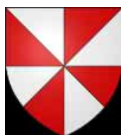
Skoed Plourc'han Écu de Plourhan