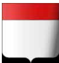
Skoed Goueloù Écu du Goëlo