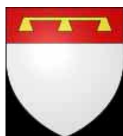
Skoed Kintin Écu de Quintin