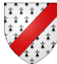
Enez-Vriad Île de Bréhat